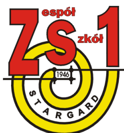
Zespół Szkół nr 1 Im. Mieszka I w Stargardzie Szczecińskim