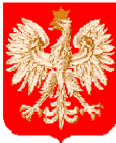
Ministerstwo Edukacji Narodowej