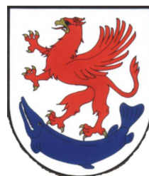
Starostwo Powiatu Stargardzkiego